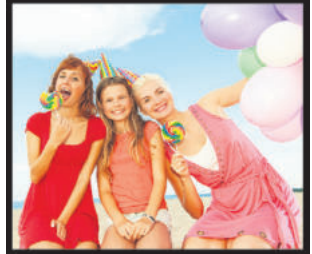
фото Все для вас